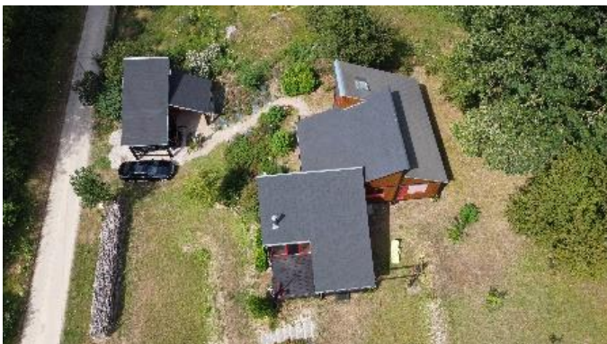
Droge zomer, geen groen gras!